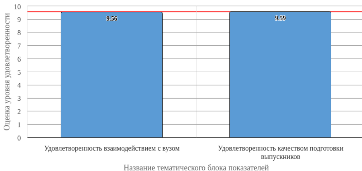
Рисунок 2.1 - Средняя оценка удовлетворенности (по тематическим блокам показателей)

Средняя оценка удовлетворенности респондентов по блоку вопросов «Удовлетворенность взаимодействием с вузом» равна 9.56, что является показателем высокого уровня удовлетворенности (75-100%).